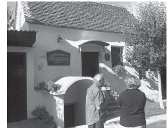
Das erste Wohnhaus mit der Tafel.