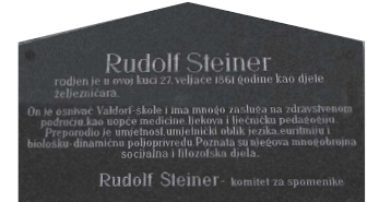
Erinnerungstafel am Wohnhaus der Familie Steiner mit dem kleinen Rudolf.