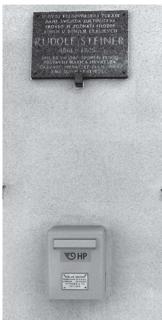
Die Erinnerungstafel am Bahnhofgebäude. Und grad darunter geht die Post ab.