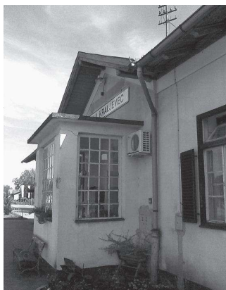
Der Bahnhof in Kraljevec. In diesem Gebäude sei Rudolf Steiner, neuesten Forschungen zufolge, während des Nachtstundes des Vater geboren.